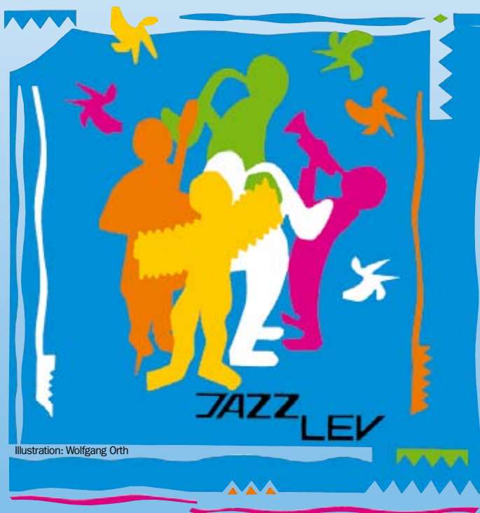
Illustration: Wolfgang Orth

JAZZ LEV Jazz Leverkusener e. V., Verein zur Förderung der Jazzmusik gegründet: 1978 Hauptstraße 134 · 51373 Leverkusen Tel.: 02 14 / 4 15 55 · www.jazz-lev.de