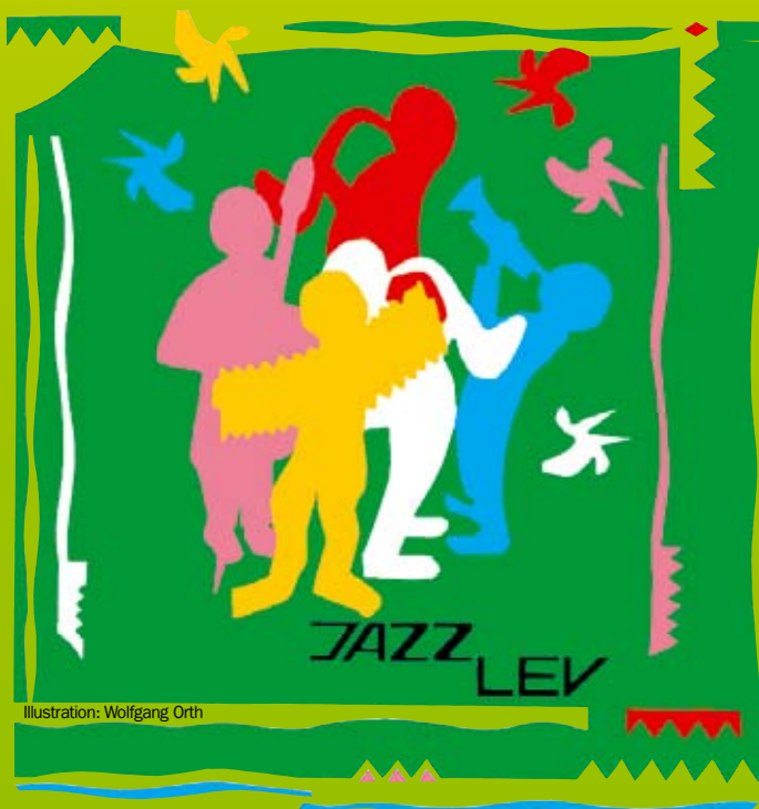
Illustration: Wolfgang Orth

JAZZ Jazz Leverkusener e. V., Verein zur Förderung der Jazzmusik gegründet: 1978 LEV Hauptstraße 134 · 51373 Leverkusen Tel.: 02 14 / 4 15 55 · www.jazz-lev.de