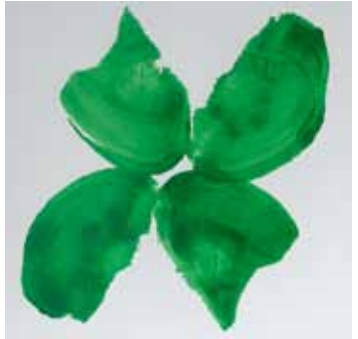
Gemälde: Norbert Arns