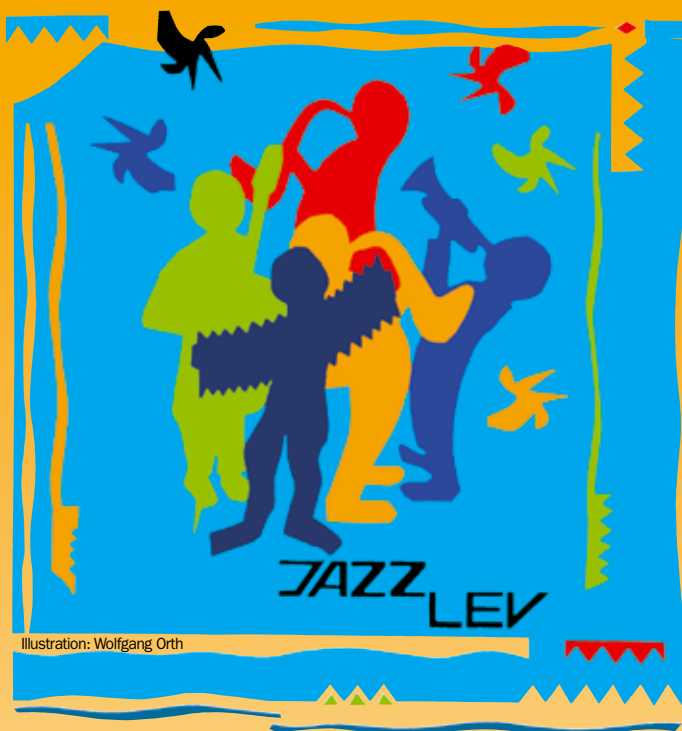
Illustration: Wolfgang Orth

JAZZ LEV Jazz Leverkusener e. V., Verein zur Förderung der Jazzmusik gegründet: 1978 Hauptstraße 134 · 51373 Leverkusen Tel.: 02 14 / 4 15 55 · www.jazz-lev.de