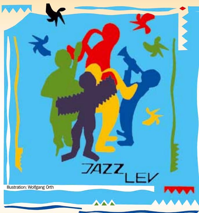
Illustration: Wolfgang Orth