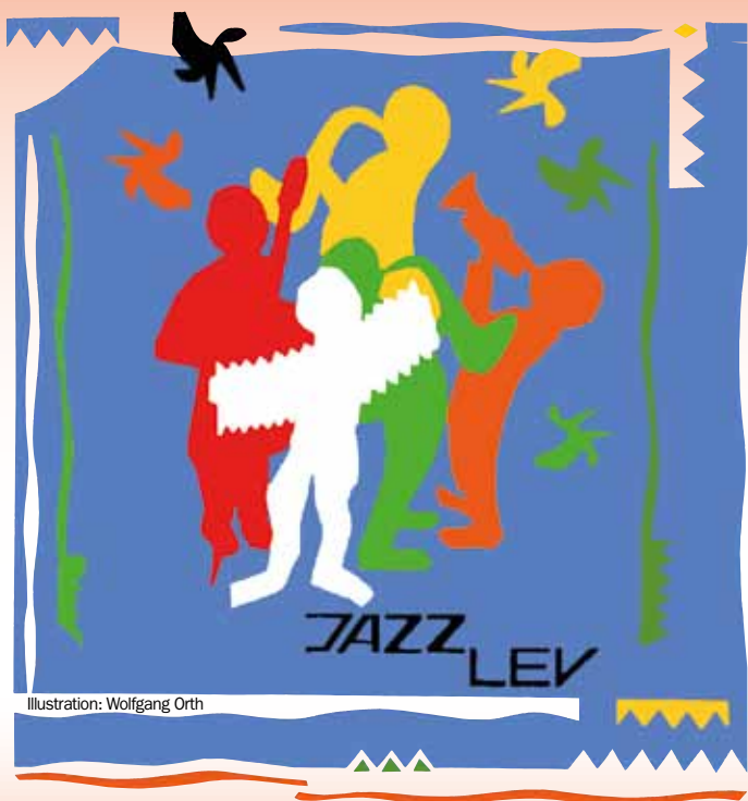
Illustration: Wolfgang Orth