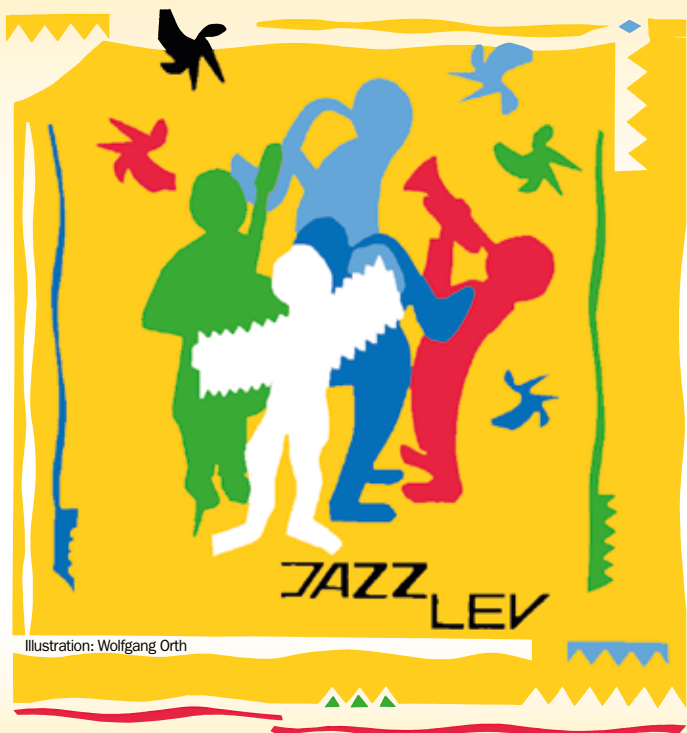
Illustration: Wolfgang Orth