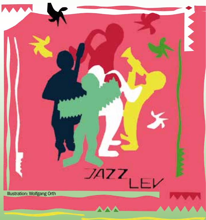
Illustration: Wolfgang Orth