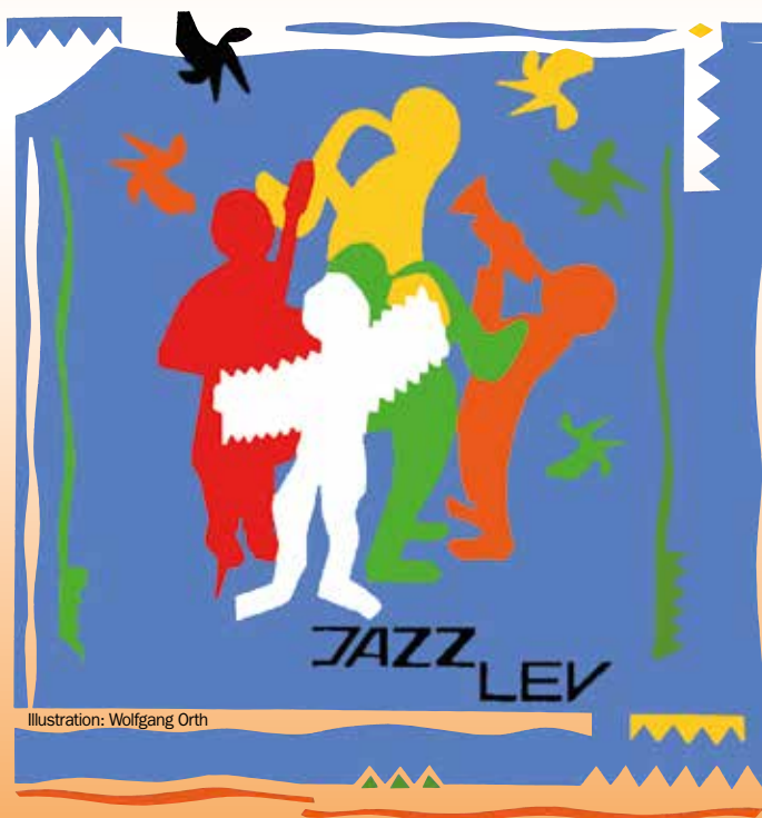
Illustration: Wolfgang Orth