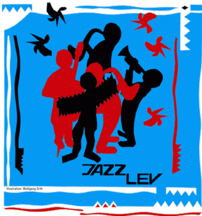
Illustration: Wolfgang Orth