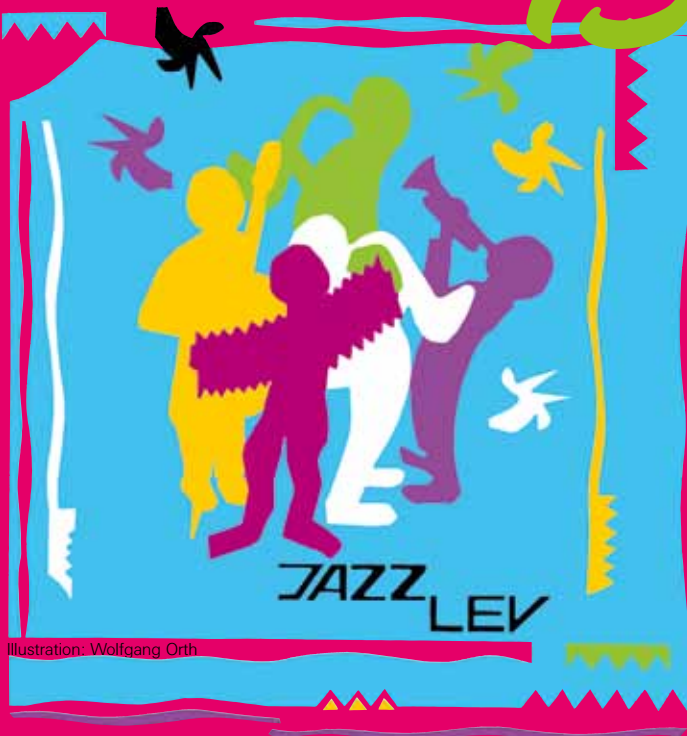
Illustration: Wolfgang Orth