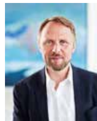
Oberbürgermeister Uwe Richrath

Wir danken den Sponsoren für die Unterstützung von Streetlife 2017