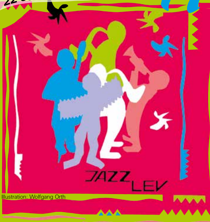
Illustration: Wolfgang Orth